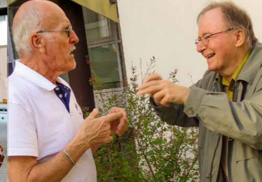
Café OHRient", Bonn