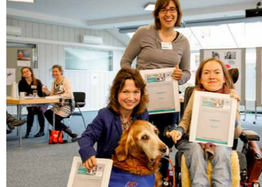
Hildegardis-Verein e.V. Bonn

Mo - Do von 13.00 - 15.00 Uhr „SAM'S Cafe“ in der Cafeteria der KHG-Bonn