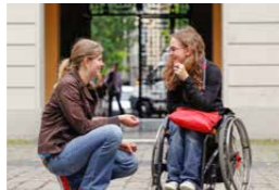
Hildegardis-Verein e.V. Bonn